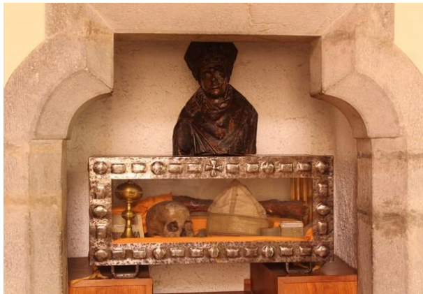
Reliquaires de saint Pierre de Tarentaise Provenant de la Grâce-Dieu en 1909

Providence, s'installer à Tamié en 1909, là où saint Pierre de Tarentaise fut le premier abbé et fondateur de l'abbaye en 1133. La jambe gauche avait été apportée par les moines arrivés de La Grâce-Dieu. La droite et le bassin fut remis à la communauté de Tamié par le curé de l'église de Saint-Georges alors en cours de rénovation, en 2008. C'est ainsi que saint Pierre est revenu à Tamié sur ces deux jambes l'une après l'autre, après plus de 850 ans d'absence.