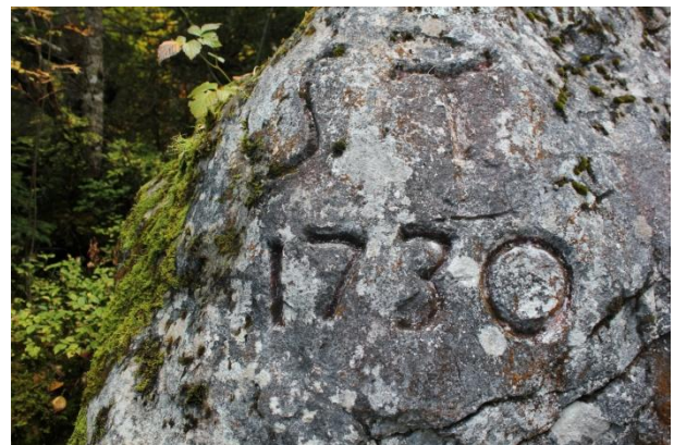
Lors de la création du cadastre en 1730 des bornes furent plantées ou des marques gravées sur des rochers pour préciser les limites des propriétés Ici la limite entre la commune de Seythenex et l'abbaye de Tamié

Mercredi 18 : Pour le ciné forum Mario Ponta nous propose : 11 minutes 11 septembre 2001 . Ce sont 11 évocations, de 11 minutes chacune, relatives à la façon dont l'évènement a été perçue dans 11 cultures différentes par 11 réalisateurs de 11 pays. Nous pouvons échanger ensuite entre nous.