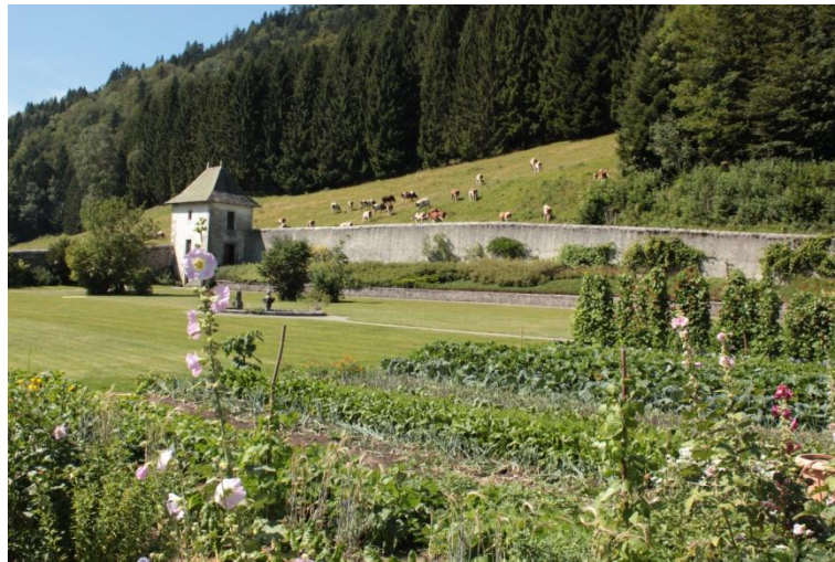
Le jardin donne ses fruits et les vaches broutent une herbe plutôt sèche

Samedi 7 : Deux membres des Kind's Men nous présente leur mouvement. Il a débuté il y a 6 ans en Hollande, en lien avec la communauté des Béatitudes. Le but est d'apprendre à devenir père. Ils ont entre eux des partages d'expérience et vivent leur vie de famille ordinaire.