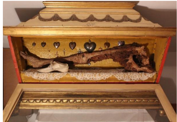
Provenant de Vesoul en 2009

Samedi 14 : De nouvelles chaises à haut dossier, plus confortables que celles à dossier bas ont été financées par une amie de la communauté. La trentaine est installée pour les fidèles entre les deux arches.