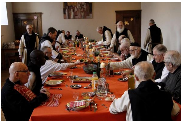
La table des Frères