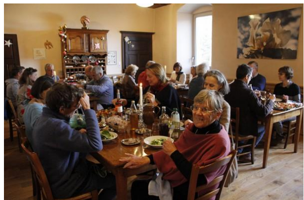
La table des hôtes

Vendredi 28 : Le jardin se met en veille pour l'hiver. Les dernières salades sont servies au réfectoire.