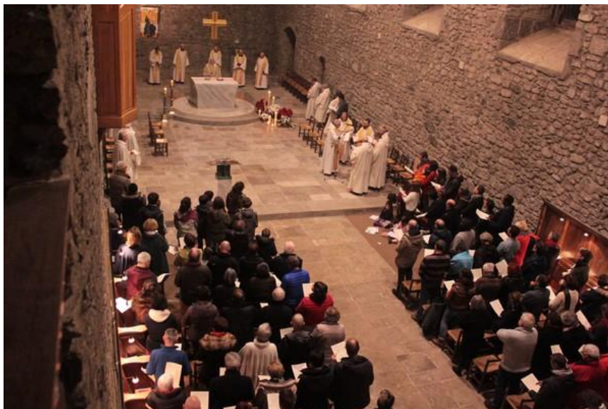
La messe de minuit

Mardi 25 : NOËL - Un enfant nous est né. Tout est à nouveau possible.