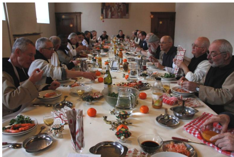
Après la messe du jour en communauté

(Il n'y a pas de photographie à l'église pendant les cérémonies)