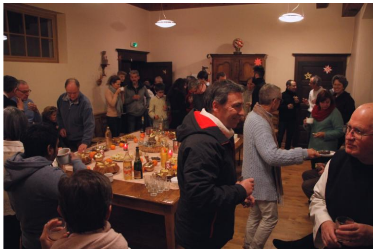
Noël - Après la messe de minuit à l'hôtellerie

(Il n'y a pas de photographie à l'église pendant les cérémonies)