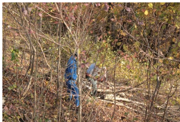
Couleurs d'automne sous le soleil de Tamié ( Forêt ) - ( Feuillage )