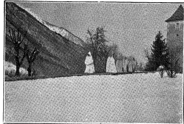
L'hiver à Tamié L'unique promenoir... le mur du jardin